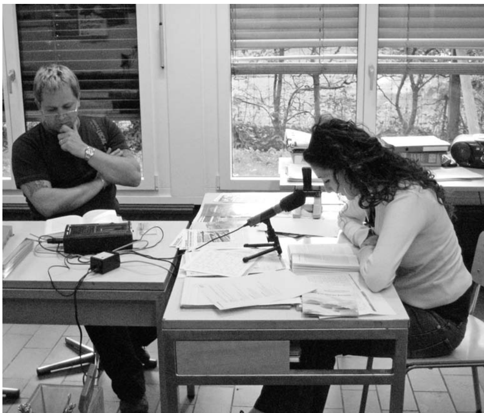
Ausspracheübungen im Nachbetreuungsatelier mit Hilfe eines Tonbands

Aufgaben werden gelöst, Lernblockaden abgebaut, Stofflücken aufgefüllt, Prüfungen vorbereitet und Arbeiten geschrieben. Jeweils vor Abgabetermin von Vertiefungsarbeiten für die Berufsfachschule wird es hektisch und manchmal bis spät in die Nacht hinein gearbeitet. An allen Standorten leiten engagierte und erfahrene Lehrpersonen die Ateliers. Diese vielseitige und spannende Arbeit ist fester Bestandteil ihres Pensums.