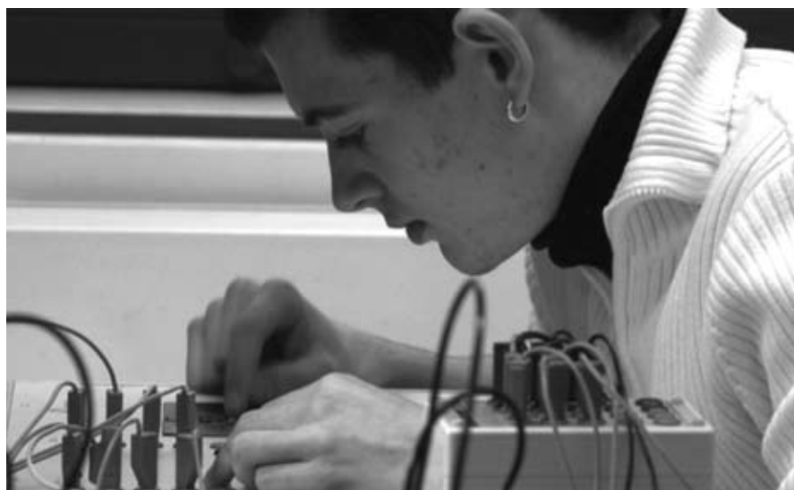
Automatiker bei einem Experiment

Die gute Zusammenarbeit, der günstige Preis und die hohe Qualität der Ausbildung sind bei den Betrieben sehr gefragt, so dass auch Banken und Dienstleistungsunternehmen ihre technischen Lernenden zu aprentas in die Ausbildung schicken. Zurzeit werden in den technischen Berufen rund 110 Lernende aus 20 verschiedenen Betrieben ausgebildet.