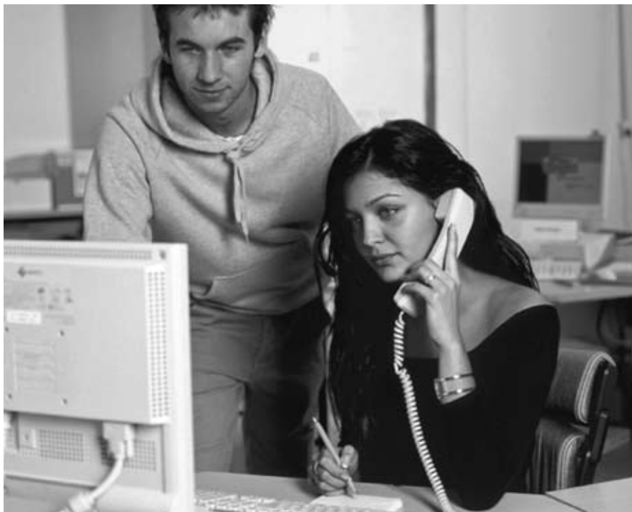
Kaufleute bei der Arbeit