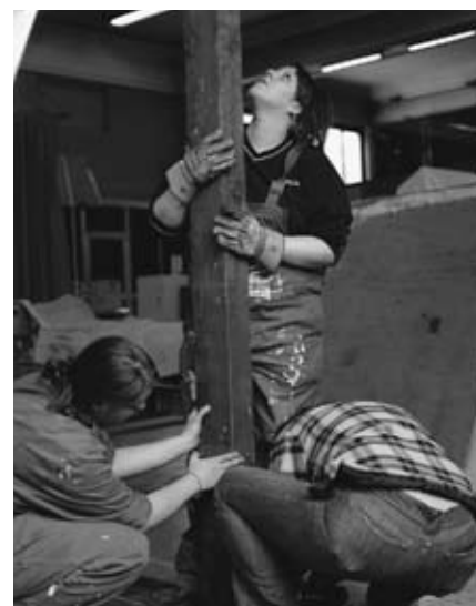
«check-in» Teilnehmerinnen beim Einrichten der Werkstatt