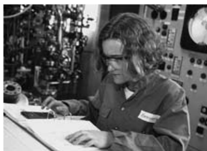
Chemie- und Pharmatechnologen überwachen die Steuerung im Lehrpilot

Das Ausbildungsmodell für die Chemie- und Pharmatechnologinnen und -technologien ist auf die besonderen Bedürfnisse in diesem Beruf angepasst. Der Unterrichtsstoff der Berufsfachschule und der betrieblichen Ausbildung wird in themenzentrierten Lerneinheiten vollständig vernetzt und in kleinen Lerngruppen vermittelt. Für die Ausbildung steht ein Pilotbetrieb zur Verfügung. In den ersten zwei Lehrjahren lernen die angehenden Berufsleute so den sicheren Umgang mit den hoch technologisierten Apparaten und können dann im dritten Lehrjahr im Schichtbetrieb mitarbeiten.